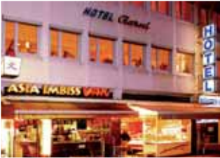
No. 09 Münster Hotel Einzelzimmer ab 33,- EUR Doppelzimmer ab 58,- EUR