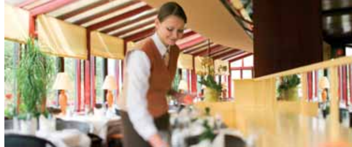
No. 23 Hotel Mövenpick Einzelzimmer ab 85,- EUR Doppelzimmer ab 100,- EUR

Die Tagung findet in Kooperation mit dem Hotel Mövenpick statt, das sich direkt an das Edwin Scharff Haus angebauten Gebäude befindet. Um eine frühzeitige Reservierung wird gebeten. Im Mövenpick Restaurant lässt sich die ganze Vielfalt der Gastronomie genießen.