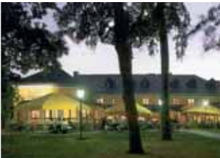
No. 16 Hotel Brauhaus Barfüßer Einzelzimmer ab 62,- EUR Doppelzimmer ab 82,- EUR