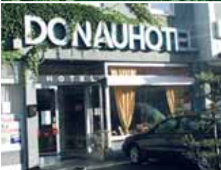
No. 66 Donau-Hotel Einzelzimmer ab 45,- EUR Doppelzimmer ab 70,- EUR