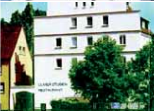
No. 29 Hotel Ulmer Stuben Einzelzimmer ab 58,- EUR Doppelzimmer ab 78,- EUR