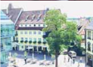
No. 25 Hotel am Rathaus Einzelzimmer ab 62,- EUR Doppelzimmer ab 92,- EUR