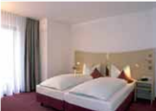
No. 19 City-Hotel in Neu-Ulm Einzelzimmer ab 63,- EUR Doppelzimmer ab 85,- EUR