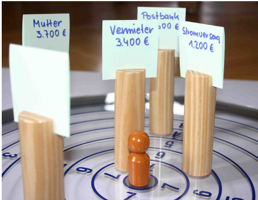
Abb. 3: Skalierung in der Schuldnerberatung