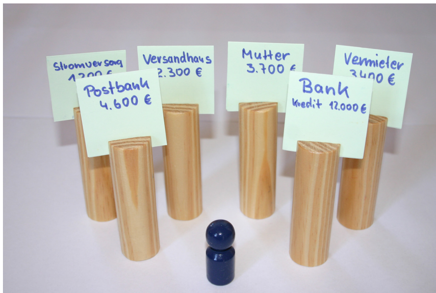
Abb. 2: Vorbereitete Figuren für die Arbeit mit der Skalierungsscheibe in der Schuldnerberatung

In Vorgesprächen werden die genauen Schulden und die Gläubiger ermittelt. Das Wissen darum ist eine Voraussetzung für diese Form des Einsatzes der Skalierungsscheibe in der Schuldnerberatung. Der Schuldner selbst kann die