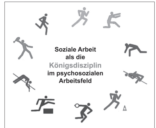
Abb. 2: Sozialarbeit als Königsdisziplin

können. Damit gleichen sie den Zehnkämpfern und Siebenkämpferinnen in der Leichtathletik: Sie beherrschen eine ganze Reihe von Disziplinen (Laufen, Springen, Werfen – in unterschiedlichen Ausgestaltungen), ohne es in einer einzelnen zur Perfektion zu bringen: ihre besondere Stärke liegt gerade in der Multidisziplinarität, ihrer Vielseitigkeit – und der Siebenkampf (bei Frauen) und der Zehnkampf (bei Männern) gelten gerade aus diesem Grund als die Königsdisziplinen. In ähnlicher Weise lässt sich die Soziale Arbeit als die Königsdisziplin im psychosozialen Feld betrachten: SozialarbeiterInnen verfügen über ein reichhaltiges Wissen,